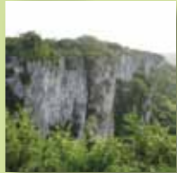
Falaise calcaire avec végétation adaptée