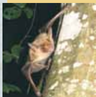
le Petit Murin