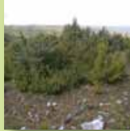
Lande à genévriers