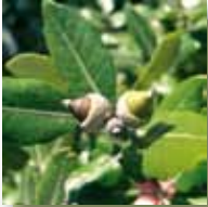
Forêt de Chênes verts