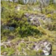
Lande à buis sur pente rocheuse