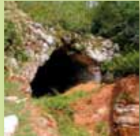
Grotte non exploitée par le tourisme