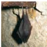
le Petit Rhinolophe