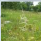
Pelouse sèche sur calcaire