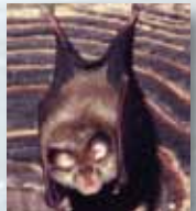
le Petit Rhinolophe

Un territoire de qualité où de nombreuses espèces remarquables profitent d'une mosaïque de milieux naturels, secs sur les plateaux et les falaises, frais à humides en fond de vallon. Il offre ainsi une grande diversité biologique.