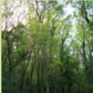
Forêt de bas de pente à frênes et tilleuls