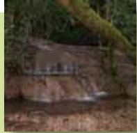
Source pétrifiante avec travertins