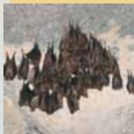
le Rhinolophe euryale