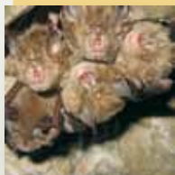
le Grand Rhinolophe