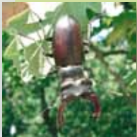
le Lucane cerf-volant