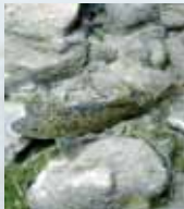
le Barbeau méridional