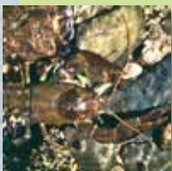
l'Ecrevisse à pattes blanches

Le site Natura 2000 des « Gorges de l'Aveyron, causses proches et vallée de la Vère » est une Zone Spéciale de Conservation (ZSC) .