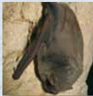
le Minoptère de Schreibers

Les activités humaines entraînent une diminution de leurs populations, par le dérangement en période d'hibernation (trop souvent fatal) ou de mise bas et d'allaitement (mortalité accrue des jeunes).