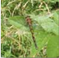
la Cordulie à corps fin