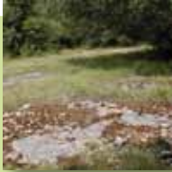
Pelouse pionnière sur dalles rocheuses