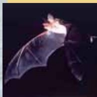
le Grand Murin

Les chauves-souris sont des petits mammifères volants et insectivores, protégés depuis 1976.