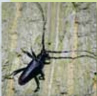
le Grand capricorne