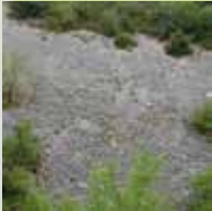
Eboulis calcaires thermophiles