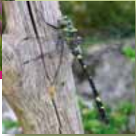
la Cordulie splendide